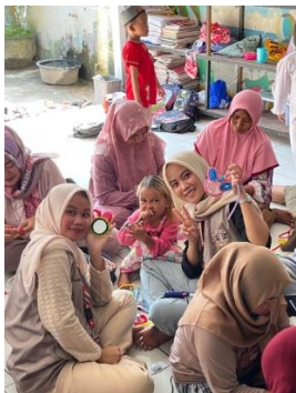
Gambar 2. Proses Pelatihan Kawat Bulu di PAUD Dahlia

serta mendukung penguatan ekonomi keluarga di Desa Garut.