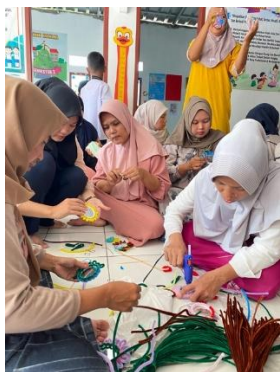
Gambar 3. Peserta Praktik Membuat Produk