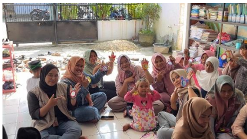
Gambar 4. Produk Hasil Karya Peserta