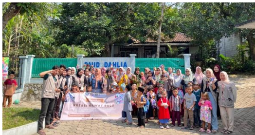
Gambar 5. Foto Bersama Peserta dan Tim KKM